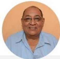
Martín Castillo Figueroa Alcalde Municipal