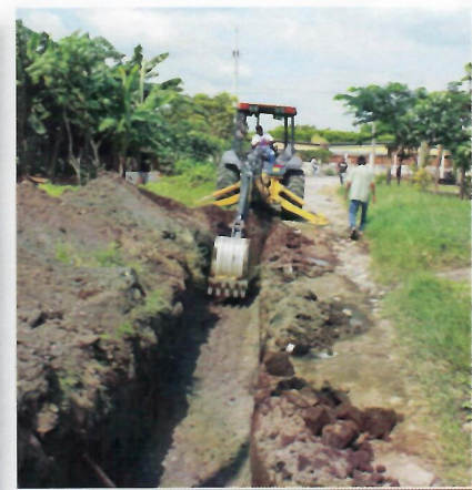
Colocación de tubería de drenaje con el fin de evitar inundamientos en el área del Básico y colonias aledañas