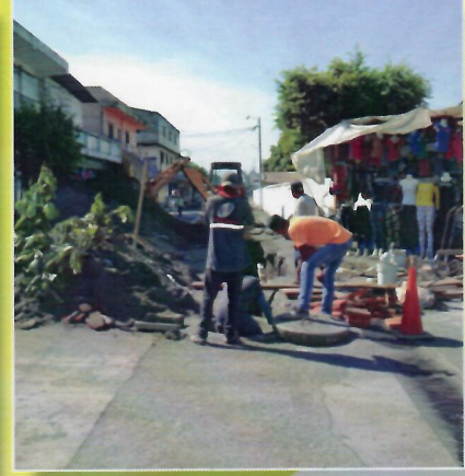
Introducción de tubería de drenaje del mercado a Callejón las Vegas